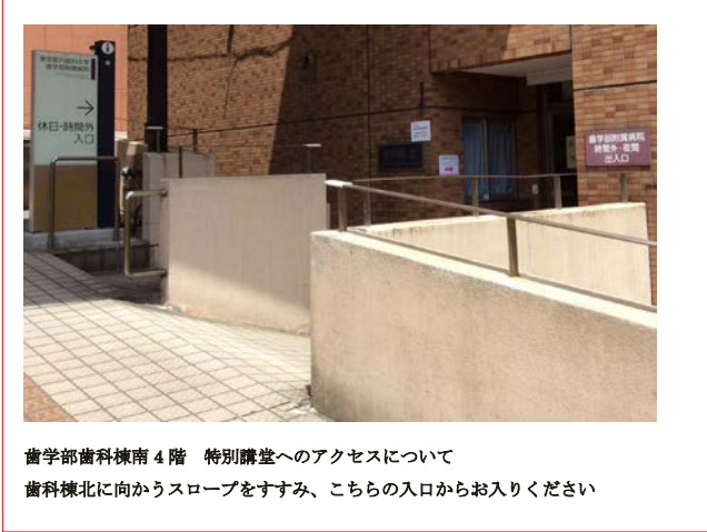
歯学部歯科棟南 4階 特別講堂へのアクセスについて 歯科棟北に向かうスロープをすすみ、こちらの入口からお入りください

懇親会場(事前申込制) 17:00~ 会場：あるめいだ (食堂棟 1階) ※階段を降りて下さい